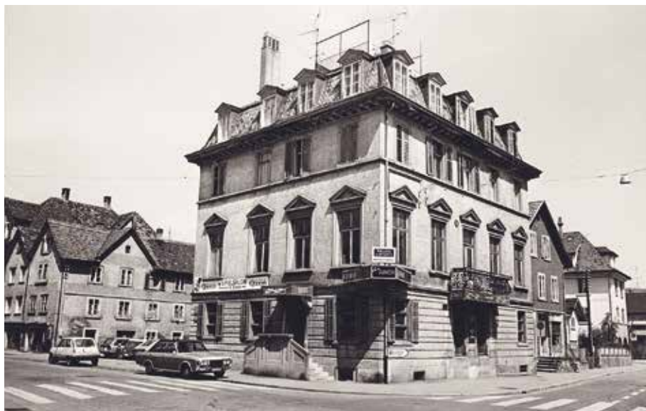
Das neoklassizistische Gebäude «Central» wurde 1976 abgerissen. Am rechten Bildrand befindet sich heute das Restaurant Tomate.