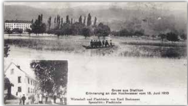
Das «Untere Fahr» im Hochwasser von 1910.