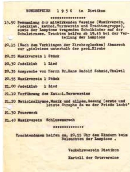
Das Programm für die Bundesfeier 1956.

Dietikon. Dieser ist bereit, sich zusammen mit der Gemeinde Unterengstringen und dem Kanton an den Kosten für eine Instandstellung und Bekiesung der Fusswege zu beteiligen. Der Kanton will jedoch nicht mitmachen. Er schlägt stattdessen ein generelles Reitverbot auf den Fusswegen entlang der Limmat vor, da die Pferde die Fusswege stark beschädigen. Dieses Reitverbot wird in der Folge – zusammen mit der Bekiesung – auf dem linken Limmatweg durchgesetzt.