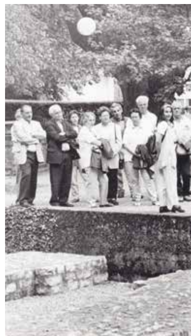
Führung durch Vindonissa an der GV 2000.