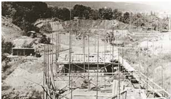
1944 stand kurz ein Terrain im «Hofacker» als Badeort im Vordergrund.

An der GV 1946 hebt der Präsident das mittlerweile sehr gute Verhältnis zwischen VVD und Gemeinderat hervor. Der Finanzvorstand wünscht weitere Vorschläge von Seiten des VVD zur Verschönerung des Dorfbildes. Die Gemeinde sichert dem VVD dafür eine jährliche Subvention von 500 Franken zu. Darauf wird als erste Verschönerung der Kronenbrunnen renoviert. Der Vorstand erhält in der Zeit nach dem