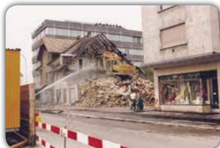
Die «Harmonie» ist gründlich zerstört (1985).