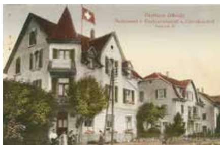
Das Restaurant Güterbahnhof trägt seit 1976 den Namen «Pergola» (1929).