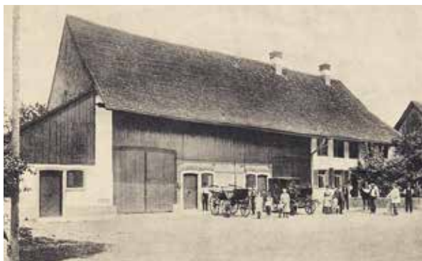
Der alte «Ochsen» mit Stallungen an der Oberdorfstrasse (ca. 1910).