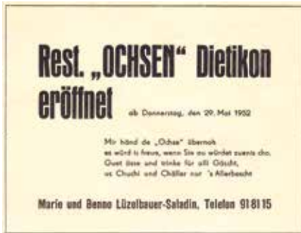
Die Lüzelbauers haben 1952 den «Ochsen» gepachtet.