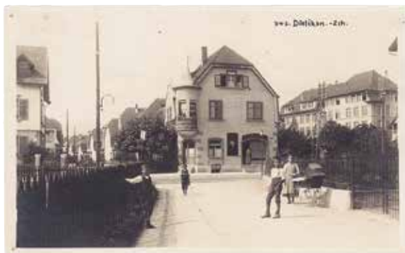
Von 1918 bis 1950 gab es im «Schlössli» der Familie Gustav Gstrein auch ein Café.

Das markante Gebäude zwischen Bahnhof- und Zürcherstrasse (Bahnhofstr. 15) mit der prächtigen Fassade und den vielen, schön unterteilten Fenstern wurde 1927 errichtet. Der Name «Glockenhof» geht darauf zurück, dass die Glocken der ehemaligen Simultankirche nach deren Abbruch (Frühjahr 1926) bis zur Einweihung der St. Agatha-Kirche (September 1927) westlich der Katholischen Notkirche (heute Standort OMIT AG), das heisst östlich des Neubaus von 1927, am alten Glockenstuhl aufgehängt waren und dort zum Gottesdienst läuteten. Im Erdgeschoss des Glockenhofes