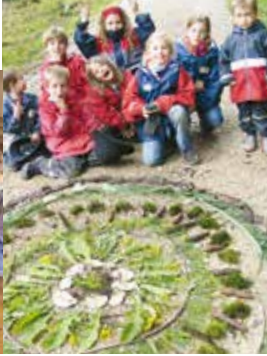
Der Waldtag des VVD erfreut auch die Kinder (2011).