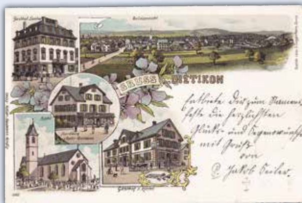
Ansichtskarte Dietikon um 1910 u.a. mit den Gasthöfen Central und Hecht.

Dieses Neujahrsblatt ist weder «Beizliführer» noch Lexikon der Stammbeizen, Stammtische und Serviertöchter. Es gibt auch keine Übersicht über die aktuelle gastronomische Szene, die sich fast monatlich verändert. Sie werden keine Qualitätssterne für die einzelnen Lokale antreffen. Das Heft möchte Entstehung und Entwicklung der alten Gaststätten schildern, die Wirte nennen und besondere Ereignisse erwähnen. In den