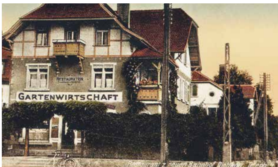
Der «Neue Bahnhof» um 1920. Hinten ein Teil der Villa Frey an der Weiningerstrasse.