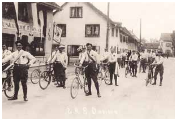
Neben dem Restaurant Harmonie steht das 1948 abgerissene Rösslibotenhaus Fischer mit der Weinschenke. Die Mitglieder des Veloclubs Dietikon sind 1930 mit eingesenkten Wadenbeinen für eine Festfahrt startbereit.

Die in Dietikon in der zweiten Hälfte des 19. Jahrhunderts vor allem auf katholischer