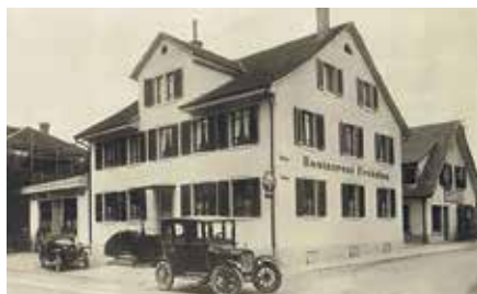
Zwei Limousinen stehen vor dem «Frohsinn». Rechts Garage Ed. Scheibler (1920).