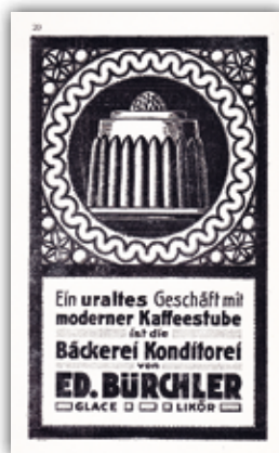
Eine prächtige Reklame im Art Déco-Stil (1921).

tente erstmals 1920 auf und zudem mit einem grossen Gugelhupf-Inserat in der Broschüre «Dietikon in Wort und Bild» von 1921. Aber es war natürlich nicht ein «Gran Caffè» mit prunkvol-