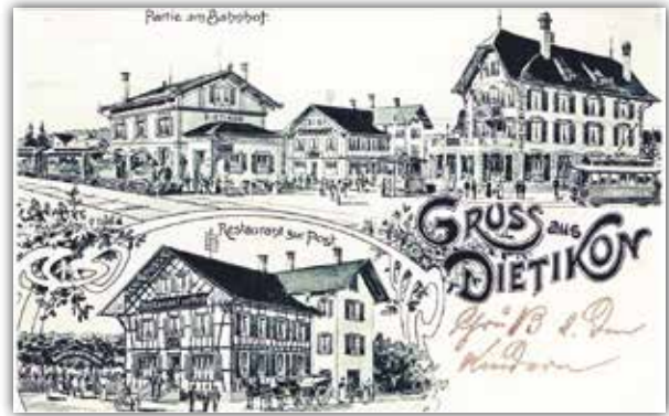
Das Restaurant Post im Verkehrsgewühl. Die Gartenwirtschaft war ein Magnet (um 1920).