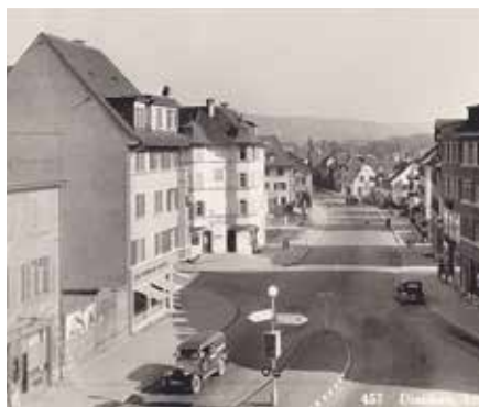
Der Löwenplatz Dietikon um 1940. Das dritte Haus links mit der hellen Fassade ist der Glockenhof.