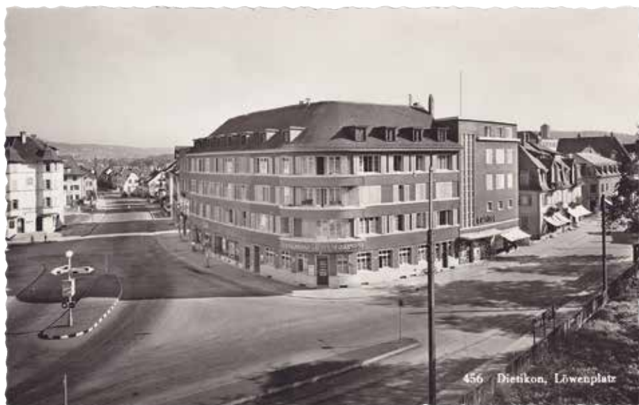
Der Gasthof Löwen als Teil des eleganten Rundbaus (um 1950 ).

Liegenschaft. Als Neuigkeit wurde damals im «Löwen» zum Café-Crème geschwungener Nidel serviert, und zwar erst noch in einem stilvollen «Chübeli». Es brauchte damals wenig, um die Dietiker zu begeistern! Neue Perspektiven brachte für einige Dietiker die Fasnacht 1944 im «Löwen»: Die Serviertöchter tanzten nämlich füdliblutt auf den Tischen! Eine grosse Attraktion für die Jungen bildete der Billardkasten. Viele katholische Jünglinge fanden am Sonntagmorgen dieses Vergnügen weit spannender als der Besuch des Gottesdienstes. Zur Sicherheit wurde dann aber doch noch ein heimkehrender Messebesucher rasch gefragt, wer die Predigt gehalten habe. So konnte man im kritischen Fall am Mittagstisch zu Hause mit beruhigender Sicherheit erklären, es treffe zu, dass der Vikar C. oder M. wieder mal ein mächtiges Kanzelwort gehalten habe! Hätte die Mutter auch noch