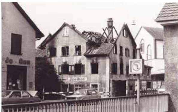
Die Ruine «Freihof» nach dem Brand von 1982.