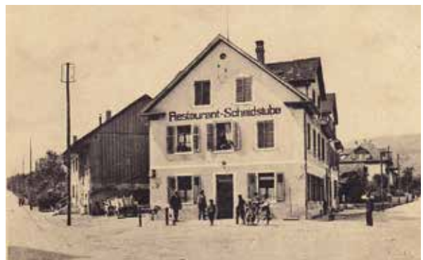
Die 1895 zur Wirtschaft umgebaute Schmiede.

Das unübersehbare Gebäude im Spickel Bremgartner-/Oberdorfstrasse ist 1853 als Schmiede erbaut worden. Die Kundschaft bestand vor allem aus Kutschern und Fuhrhaltern, die mit Pferd und Wagen via Mutschellen nach Bremgarten/Wohlen/Bern unterwegs waren. Aber es gab auch Reparaturen an Pflügen, und an Holz-