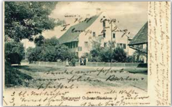
Der alte «Ochsen» um 1916. Der Strohwagen auf der Verzweigung ist noch kein Verkehrshindernis.