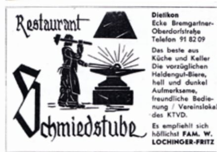
Inserat im Kirchenblatt von 1950.

Der aus Traun in Oberösterreich stammende Benno (eigentlich Benedikt Josef 1901 – 1977) war ein guter Koch und vor allem ein fideler, gutmütiger, optimistischer «Kumpel», der es mit niemandem verderben wollte. Gerne prophezeite er den Gästen mit listigen Augen hinter der Flaschen-