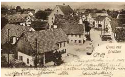
Eine Komposition der Limmattal-Strassenbahn nähert sich dem «Reppischbrüggli». Links beginnt die Vorstadtstrasse. Das hohe Haus ist die «Krone» (um 1910).