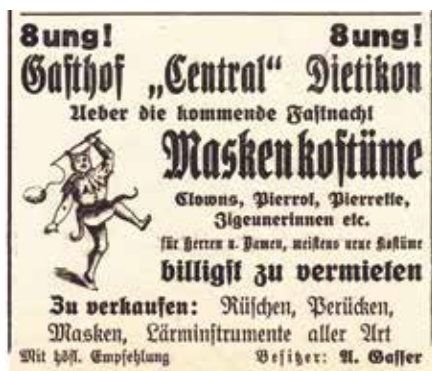
Inserat für die Vermietung von Masken- kostümen (1915).