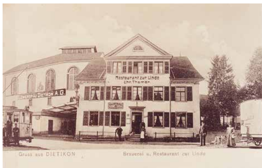
Die «Linde» im Jahr 1910. Die Limmattalstrassenbahn wartet an der Endstation auf Passagiere und Bierharassen aus der Brauerei.