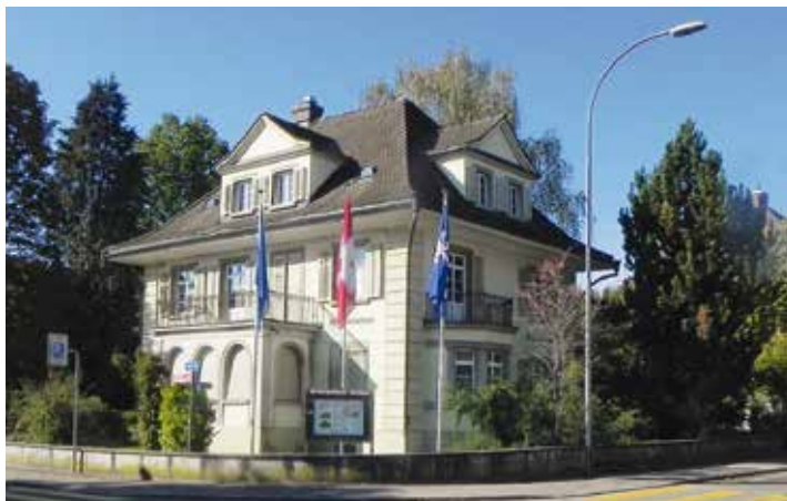
Der Stadtrat stellt dem Verkehrsverein seit 1978 die Villa Strohmeier als Ortsmuseum zur Verfügung.