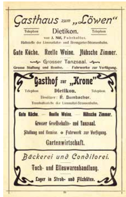
Unten: Inserat für die «Krone» im «Führer durchs zürcherische Limmattal» von 1902.

Im Jahre 1259 verkaufte Graf Rudolf von Habsburg die Gemeinden Dietikon und Schlieren dem Zisterzienserkloster Wettin-