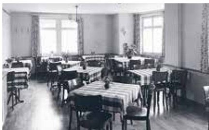
Das schlichte Interieur um 1950.

Als Folge der Wirtschaftskrise in den Dreissigerjahren waren viele Dietiker arbeitslos geworden. In diesem Zusammenhang wurde 1933 der Gemeindestubenverein in Form einer Genossenschaft