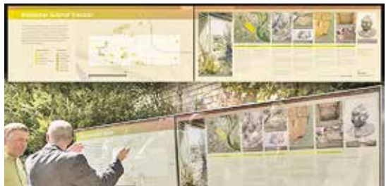
Die 2009 bei Bahnhof aufgestellte Informationstafel über den römischen Gutshof.

Die Kommission ist auch dafür besorgt, dass die Vergangenheit im Stadtraum präsent ist. Etwa mit dem 2007 von der Zürcherstrasse an die Limmat versetzten Masséna-Stein, der mit einer Informationstafel ergänzt wurde. Sie zeigt, wo die Franzosen 1799 den Übergang über die Limmat errichteten. Leider wird die Tafel immer wieder verspritzt und zerbeult. Mehr Glück hat da die 2009 errichtete Informationstafel beim Bahnhof zum römischen Gutshof.