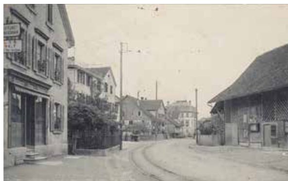
Am linken Bildrand das «Alpenrösli», ab 1912 Verkaufsladen der Firma J.R. Lips. Die LSB hält auf Verlangen. In der Bildmitte der Gasthof «Central» (1909).

heute bei jedermann gute und beruhigende Gefühle mit Wochenende- und Ferienstimmung. Vielleicht wollte Simon damit auch einen ruhenden Gegenpol zur nahen «Vorstadtstrasse» schaffen, obwohl diese alles andere als vorstädtischen Charakter aufwies. Die Pferdestallungen Simons befanden sich