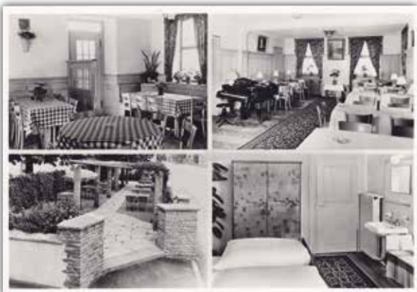
Drei Innenaufnahmen der «Linde» um 1950 samt Gartenwirtschaft.