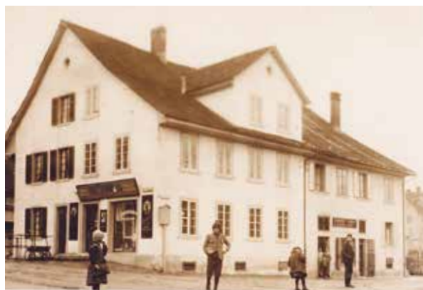
Im «Zollhaus» befand sich von 1838 – 1878 eine Schenke.

Seite sehr aktiven Mitglieder der Familie Mundweiler (wohl aus Spreitenbach zugewandert) betrieben von 1841 bis 1891 eine stark vom Stand des Reppischwassers abhängige Getreidemühle an der Bergstr. 9. Ihnen gehörte das Land am linken Ufer von der Fussgängerbrücke bei der Bühelstrasse (richtig wäre Brühlstrasse) bis zur «Zollbrücke» hinunter. Im ehemaligen Zollhaus (heute Badenerstr. 1) eröffnete