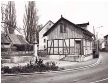
Das «Färberhüsl» am rechten Reppischufer.

Die beiden Fusswege entlang der Limmat sind von der Limmatbrücke beim EKZ bis nach Schlieren in einem derart schlechten Zustand, dass sie von Spaziergängern kaum noch benutzt werden können. Der VVD wendet sich mit der Bitte, diesen Missstand zu beheben, an den Gemeinderat