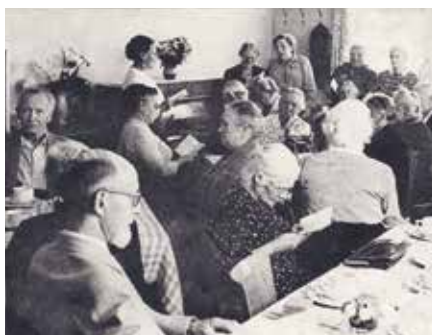
Im «Lihu» trafen sich oft die Altersklubs, die auch das Volkslied pflegten (1967).