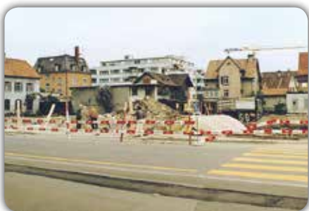
Die «Blume» liegt am Boden (1985).

Die Liegenschaft «Blume» wurde 1985 abgebrochen, um Platz für eine Neuüberbauung zu schaffen. Am 20. November 1986 fand die Wiedereröffnung statt, unter ganz neuem Vorzeichen und mit neuem Namen: «Old Flower Pub» (mit 60 Plätzen und 40 Plätzen im Boulevard-Café). Gut hundert Jahre zuvor hatte in der Londoner City eine Bar im viktorianischen Stil, die «Coates Wine Bar», mit ihrem antiken Eingang samt Pendeltüre den Anfang genommen. Als dieser typische Londoner Pub wegen Gebäudeabbruchs von der Bildfläche verschwinden musste, erwarb ein Antiquar aus Zürich die gesamte Inneneinrichtung, liess sie in England restaurieren, in Kisten verpacken und über den Ärmelkanal schiffen. Der Unternehmer Jean Schmid aus Dietikon trat als Käufer dieser Antiquität auf für sein Stockwerkeigentum an der Zürcherstr. 9. Ein Fachmann baute sie dann originalgetreu wieder ein. Es soll sich um das einzig echte und originalgetreue Londoner Pub in der Schweiz handeln bzw. gehandelt haben. Es lohnte sich, die Kuba-Mahagoni-Bar-Theke, die viktorianischen Schnitzereien und die gebogenen Spiegel näher zu betrachten. Pächter des Pub mit der speziellen Atmosphäre – man wähnte sich mitten in der englischen Hauptstadt – war von 1986 bis 1988 Richard Hürlimann, vorher auf dem «Hecht» und der «Linde» tätig. Die neue «Blume» erhielt auch ein Boulevard-Café auf der Eingangsseite. Nach Hürlimann übernahmen 1988 Gilbert Gisler und