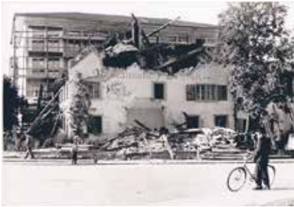
Erst nach dem Neubau wird der alte «Ochsen» 1955 abgerissen.

des damals grossen Samaritervereins, die sich zur Theorie und zu Übungen ebenfalls im 1. Stock einfanden.