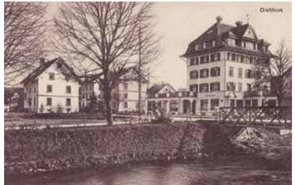
Die «Metzgerstube» mit dem angebauten Verkaufsladen. Links Haus Schifferli. Auf dem leeren Platz wird 1944 ein Mehrfamilienhaus mit einem Coiffeursalon gebaut (um 1930).