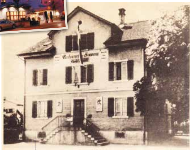
Die «Sommerau» im Jahre 1931, als sie von den beiden Brüdern Frapolli erworben wurde, und das heutige Hotel-Restaurant.