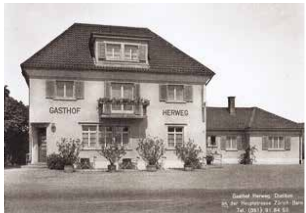
Der neue «Herweg» von 1933 mit dem Anbau von 1949.