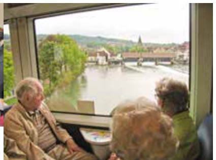
Zu Ehren des VVD und Bremgartens macht die BD bei der Rückfahrt noch schnell einen Umweg über die Reussbrücke (2008).