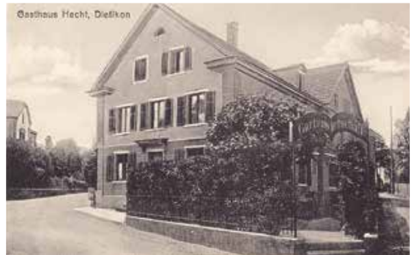
So präsentierte sich der «Hecht» 1915. Links ein Teil der Villa Viktoria an der Bahnhofstrasse.

«Dem Jonas hat's nicht wohlgetan, Im Walfisch ward ihm schlecht, Drum nimm den Ratschlag an, Komm lieber in den Hecht!»