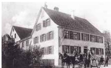
Der alte «Löwen» an der Zürcherstrasse. Die Familie Naef ist zur Abfahrt bereit (um 1900).

Anfang 19. Jahrhundert vermochte die 1259 erstmals erwähnte Taverne zur «Kro-