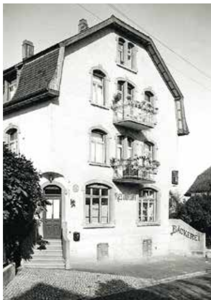
Das Restaurant Bellevue erhielt 1976 die Bezeichnung Honeret (ca. 1930).