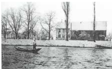
Im Winter kamen wenig Gäste ins «Fahr» (ca. 1920).

Am 22. Januar 1942 brach in der Scheune bei bissiger Kälte ein Grossbrand aus. Wohnhaus und Wirtschaft blieben zwar vom Feuer weitgehend verschont, erlitten jedoch grosse Wasserschäden. Kühe und Schweine konnten dank rascher Hilfe der Belegschaft der Zwirnerei Wettstein Oetwil gerettet werden. Aus Spargründen lehnte der Stadtrat Zürich im Oktober 1942 einen Neubau der Wirtschaft ab, stimmte jedoch einem Wiederaufbau als reiner Landwirt-