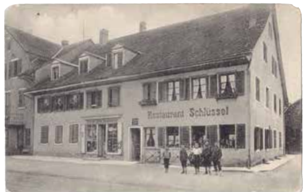
Der «Schlüssel» bekam 1920 die Bezeichnung «Harmonie».