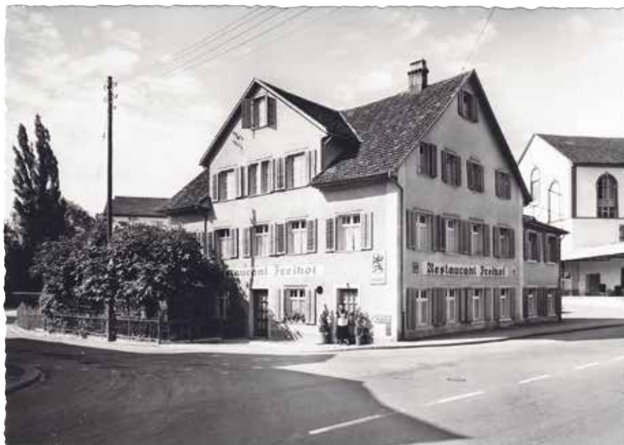
Der «Freihof» um 1960. Rechts Salamifabrik Cattaneo.