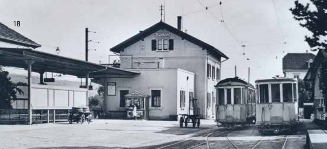
Beschaubarer Bahnhofplatz mit BDB-Station, 1930.

ausgaben der SBB müsse deshalb grundsätzlich Sache des Bundes sein. [...]