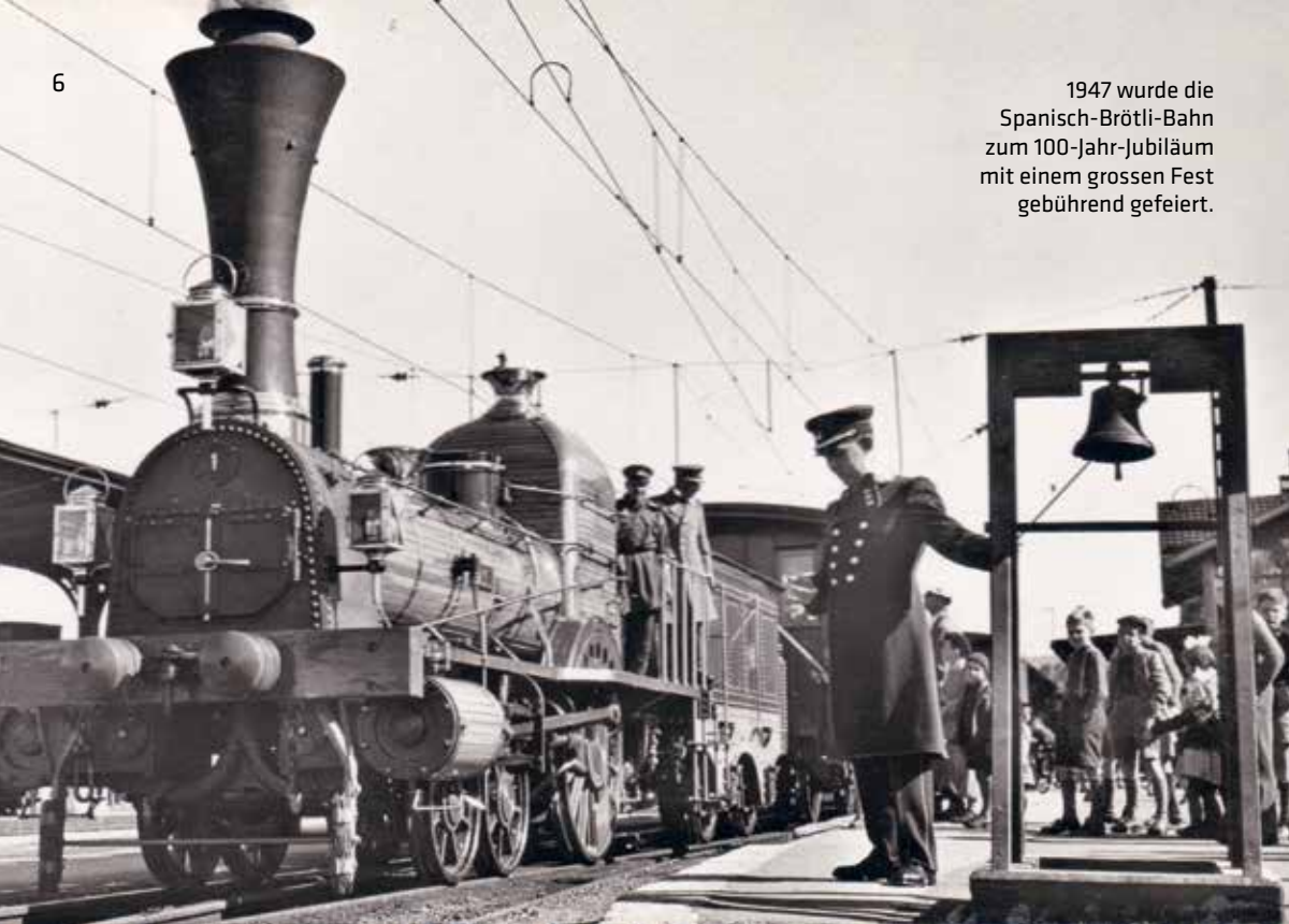
1947 wurde die Spanisch-Brötli-Bahn zum 100-Jahr-Jubiläum mit einem grossen Fest gebührend gefeiert.