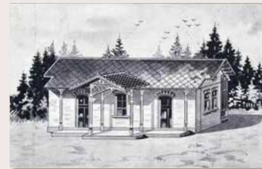
Der «Spanisch-Brötli-Bahnhof» von 1847, in Betrieb von 1847 bis 1867

Neben Zürich und Baden erhielt Dietikon als einzige Ortschaft einen Bahnhof mit Ausweichgleis. Das Gebäude diente zugleich als Wohnung für den Bahnwärter. Die Ausmasse betragen 10x5 Meter. Der Bahnhof stand dorfabgewandt zwischen Bahngeleise und Limmat auf Höhe der heutigen Bahnhofstrasse gegenüber dem späteren Bahnhof von 1867.